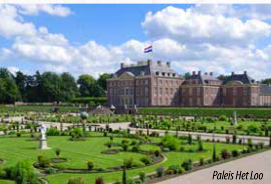
Paleis Het Loo

En daarna heb je wel energie voor de schitterende fietstocht van 16 kilometer over de IJsseldijk naar Doesburg, de derde Hanzestad in de omgeving. Bezoek het mosterdmuseum, het Laliquemuseum of de culturele zondag. Dieren mogen wij ook niet vergeten met De Spelerij, waar kinderen kunnen lassen, figuurzagen, vacuüm vormen en natuurlijk spelen.