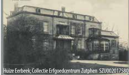
Huize Eerbeek