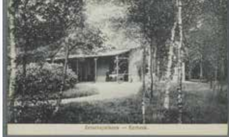
Hogeweg 14