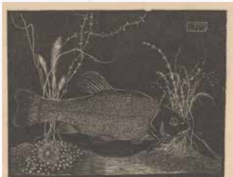
Zeelt, 1917, Jan Mankes

Jan Mankes had zijn atelier in de serre. De kunstschilder vond veel inspiratie in een kleine cirkel rondom zijn huis.