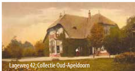
Lageweg 42