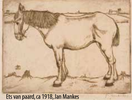
Ets van paard, ca 1918, Jan Mankes