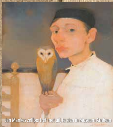
Jan Mankes zelfportret met uil, te zien in Museum Arnhem