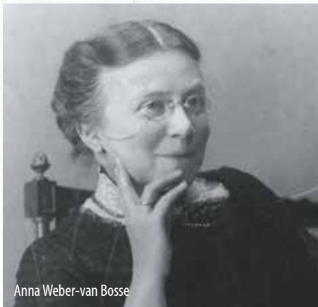
Anna Weber-van Bosse

Jan Mankes en Max Weber kenden elkaar goed. Zo kocht Weber prenten van Mankes. En zo is Mankes begonnen aan een portret van Weber, dat hij helaas niet heeft afgemaakt.