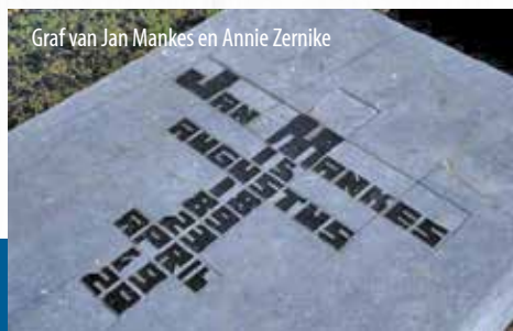
Graf van Jan Mankes en Annie Zernike

Amsterdam, Den Haag, Nunspeet en natuurlijk ook Eerbeek hebben een Jan Mankesstraat. In Eerbeek staan er arbeiderswoningen bouwjaar 1950 voor de arbeiders van de papierfabrieken. De begane grond beslaat 5,5 x 6,5 meter, totaal 36m 2 . Nog steeds is Eerbeek het centrum van de Europese papierindustrie en hebben vele inwoners werk in deze innovatieve sector.