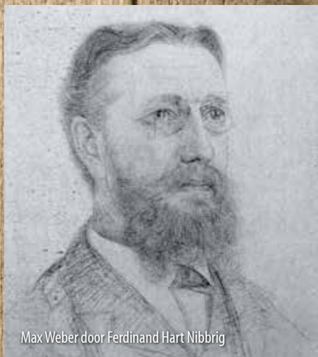
Max Weber door Ferdinand Hart Nibbrig